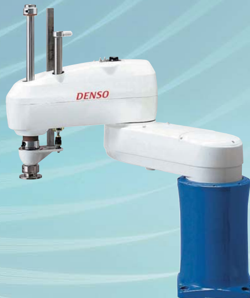
中型水平多間接ロボット HM-Gタイプ(4軸) Mid-Size Horizontal 4 Axis (Scara) Robot