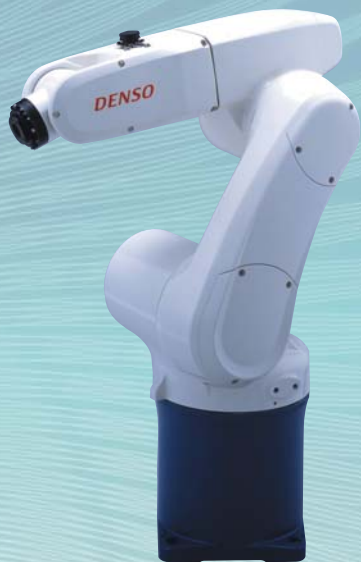
小型垂直多間接ロボット VS-Gタイプ(6軸) Small-Size Vertical 5-and-6 Axis Robot